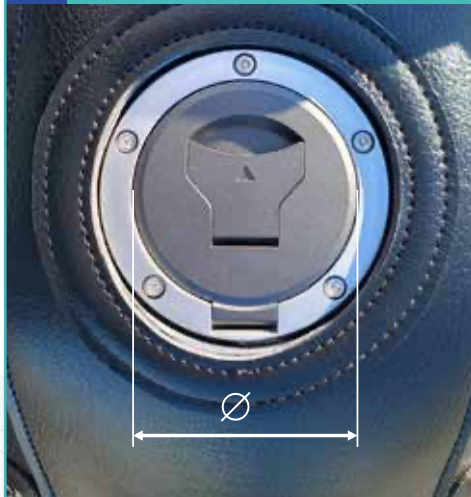
SCHÉMA 1 / DIAGRAM 1